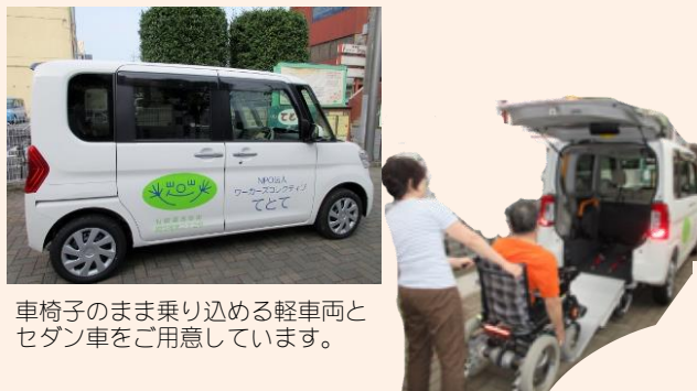
車椅子のまま乗り込める軽車両とセダン車をご用意しています。